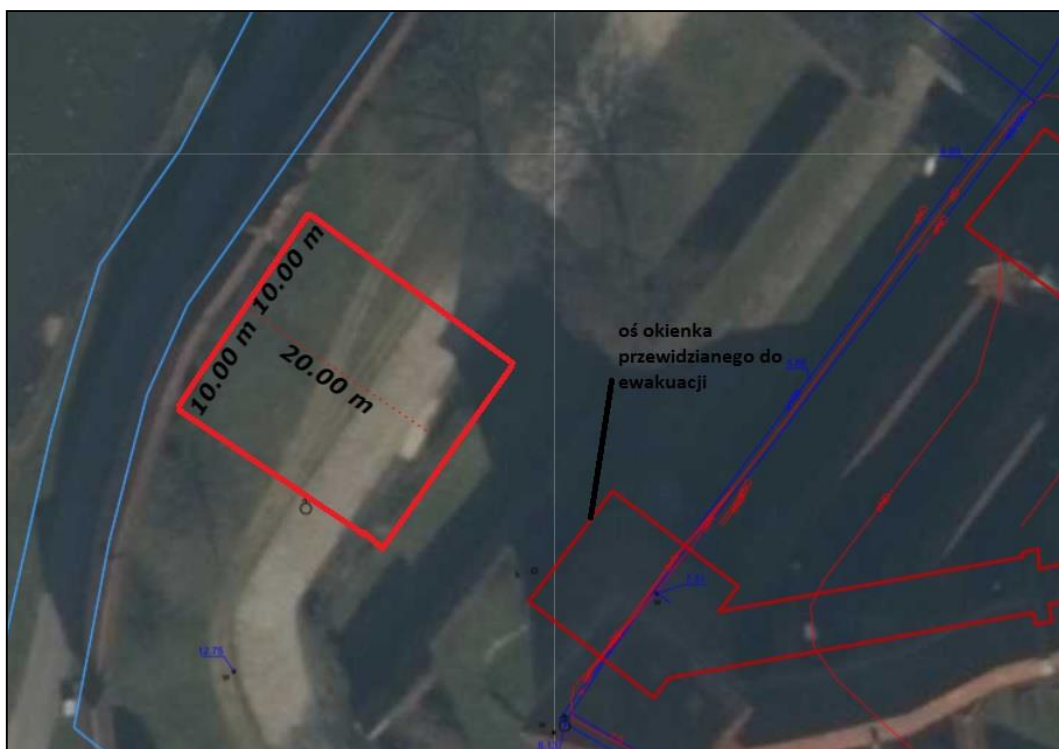
Rys. 2 Orientacyjny zakres prac nawierzchniowych z wymiarami wynikającymi z wymagań normowych