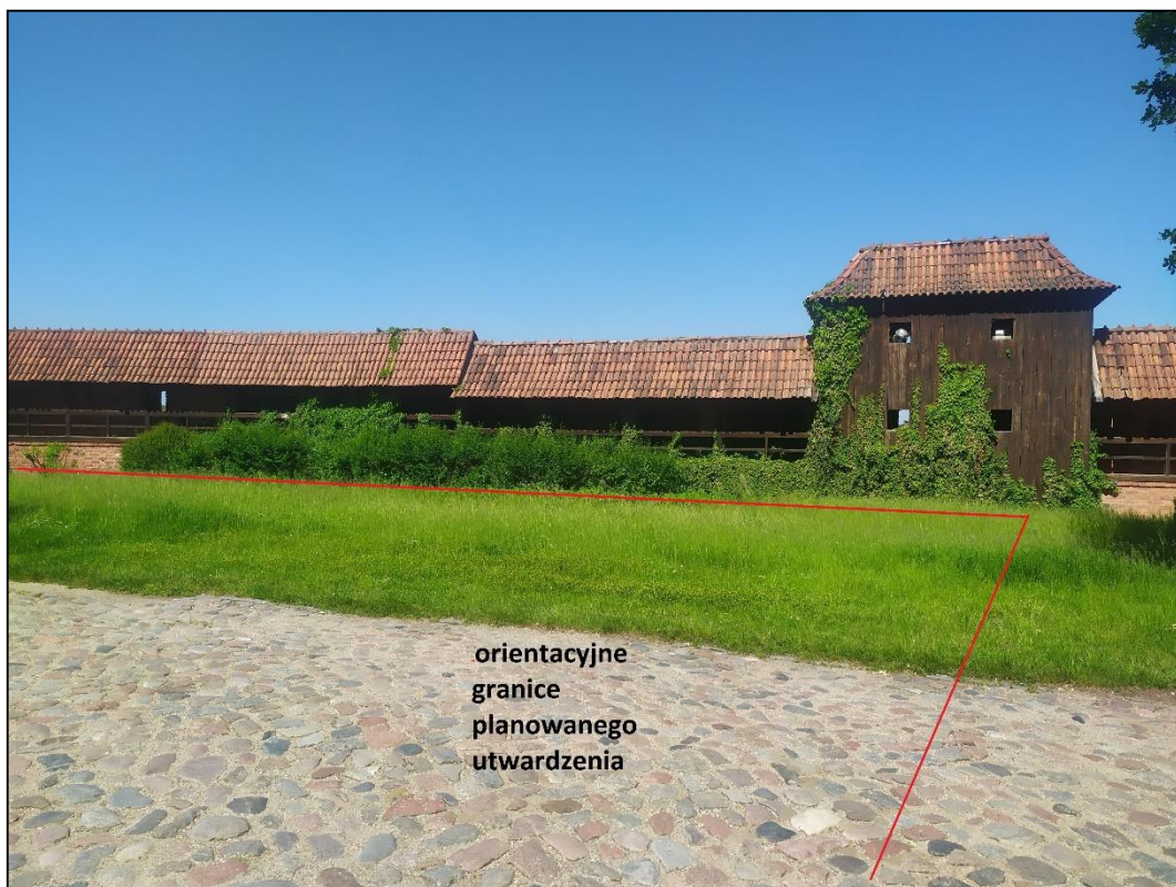
Fot. 2 Widok granicy planowanego utwardzenia po stronie południowej (od strony Gdaniska)

orientacyjne granice planowanego utwardzenia