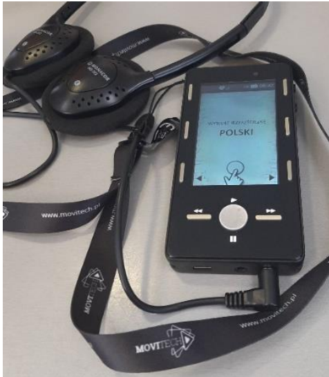
Zdjęcie 14. Audioprzewodnik

Takie urządzenie odbierzesz w okienku obok kasy.