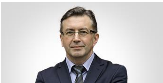
Zdjęcie 17. Dyrektor Muzeum Zamkowego w Malborku

To jest Dyrektor Muzeum Zamkowego w Malborku.