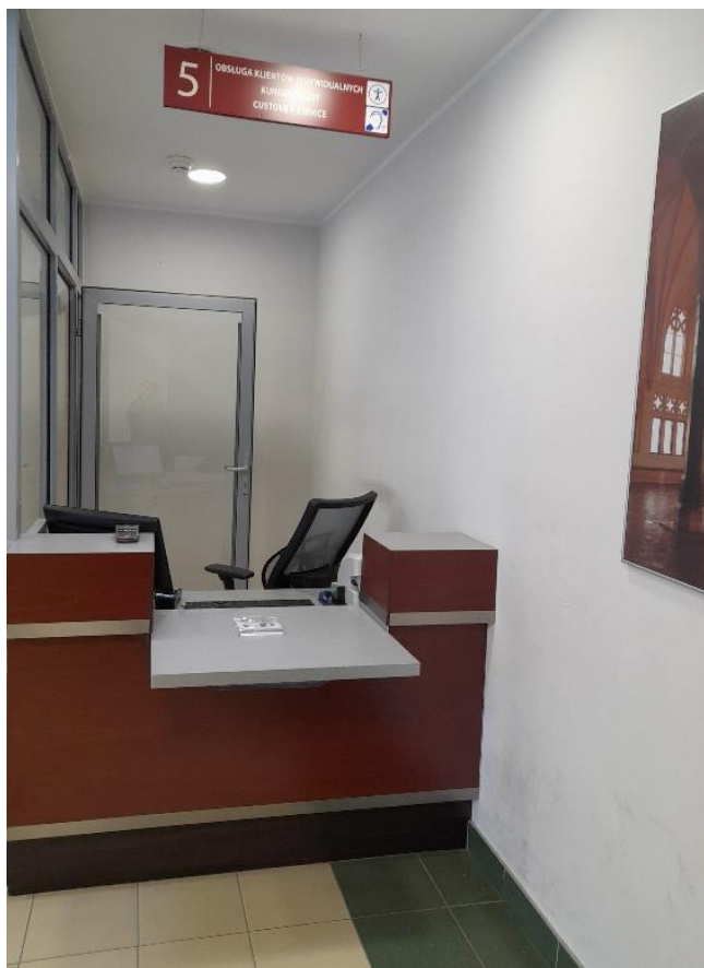
Zdjęcie 9. Punkt obsługi dla osób z niepełnosprawnościami

Jeżeli masz problemy z poruszaniem się, jeździsz na wózku lub nosisz aparat słuchowy podejdź do specjalnie oznaczonego stanowiska w rogu sali.