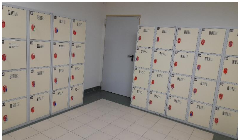
Zdjęcie 12. Szafki bagażowe

Aby skorzystać z szafki musisz mieć dwa złote w jednej monecie.