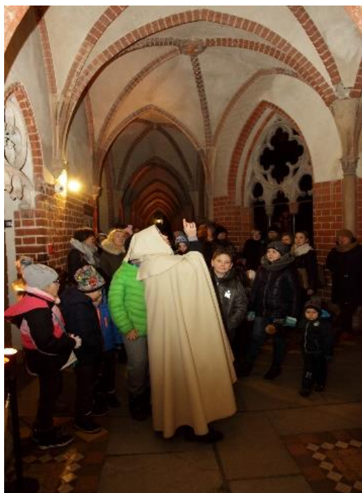
Zdjęcie 13. Zwiedzanie zamku z przewodnikiem

Ta grupa ludzi zwiedza zamek z przewodnikiem.