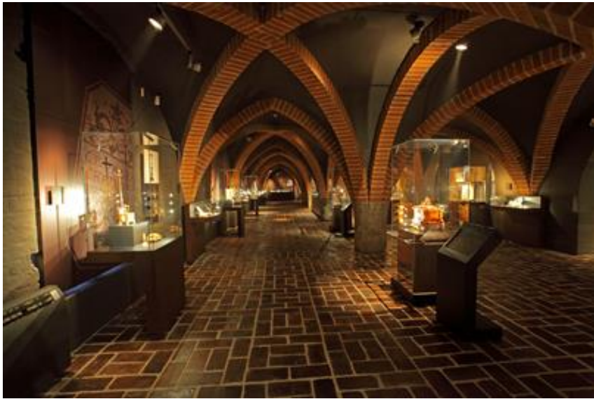
Zdjęcie 5. Sala wystawowa

Tak wygląda sala zamkowa, w której znajduje się wystawa bursztynu.