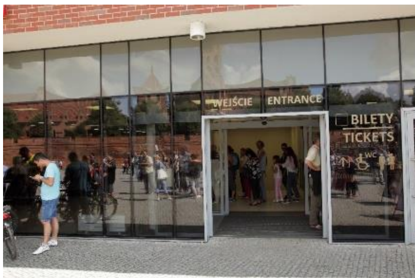
Zdjęcie 7. Wejście do budynku kasowego