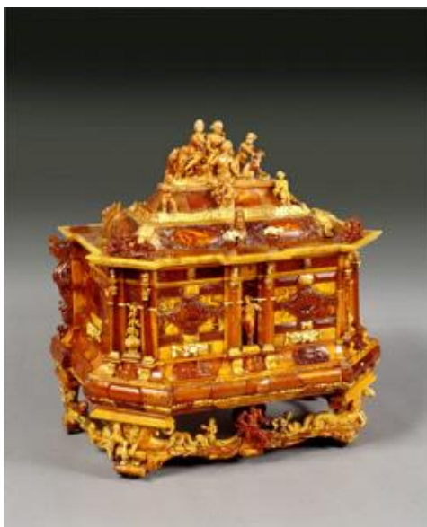
Zdjęcie 3. Szkatułka