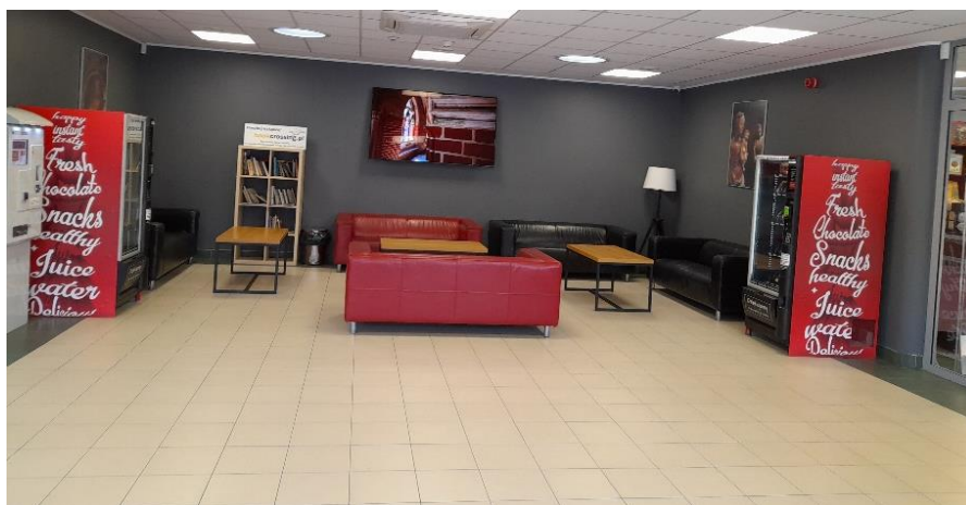
Zdjęcie 11. Poczekalnia

W poczekalni są kanapy, stoliki, półka z książkami i automaty z napojami.