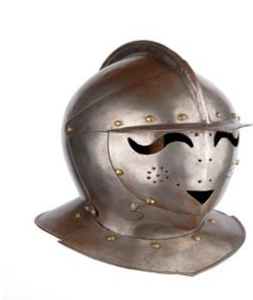
Zdjęcie 4. Hełm

Te eksponaty zobaczysz w muzeum w Malborku.