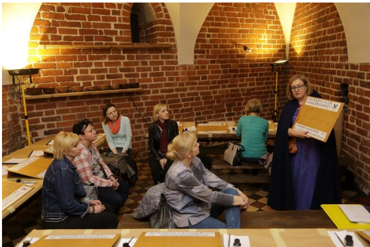
Zdjęcie 15. Lekcja muzealna

W czasie takich lekcji uczestnicy dowiadują się wielu ciekawych informacji o życiu na zamku w dawnych czasach.