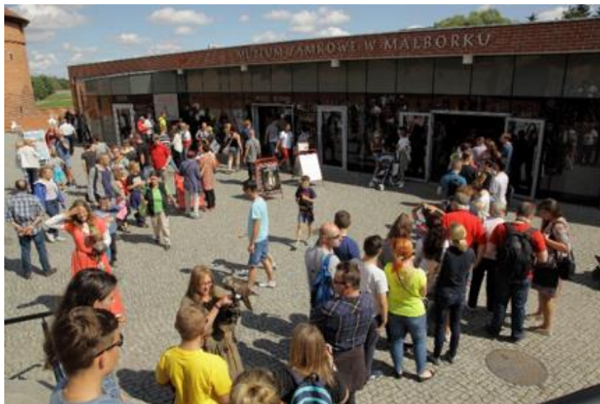
Zdjęcie 6. Plac przed budynkiem kasowym.

To jest budynek, w którym rozpoczniesz wizytę w muzeum.