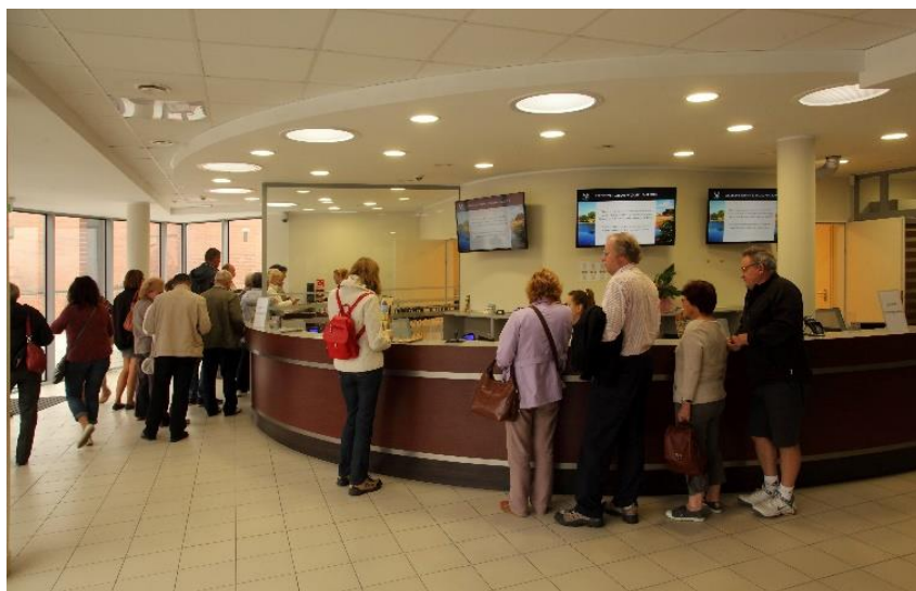
Zdjęcie 8. Kasy biletowe

To jest kasa, w której kupisz bilet do muzeum.