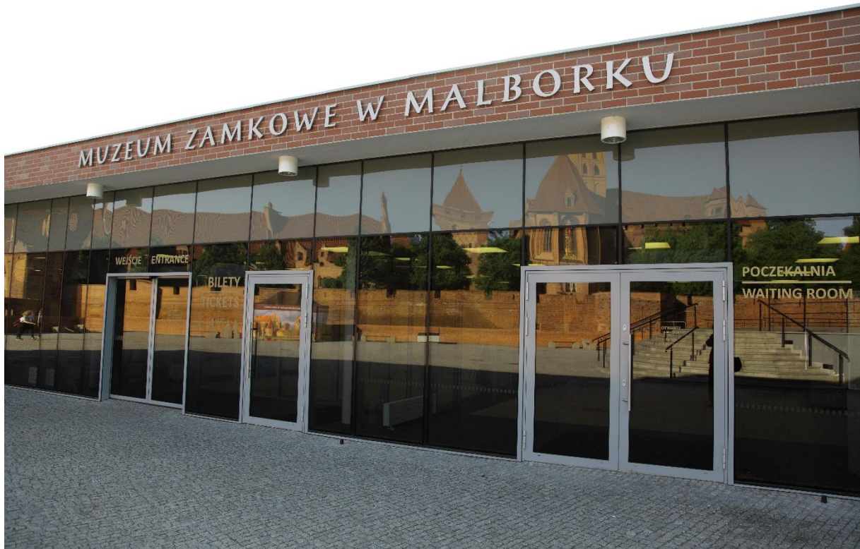
Zdjęcie 1. Budynek kasowy Muzeum Zamkowego w Malborku