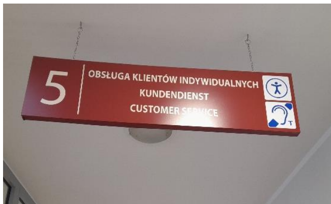
Zdjęcie 10. Tablica informacyjna

Jest tam obniżona lada i pętla indukcyjna, dzięki, której lepiej usłyszysz, co mówi do Ciebie kasjer.